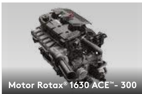
Motor Rotax® 1630 ACE™ - 300

The Rotax® 1630 ACE - 300 é o mais potente motor Rotax® jamais produzido, entregando alta eficiência e um poder de aceleração impressionante.