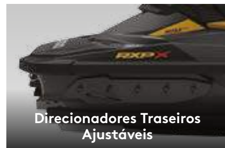
Direcionadores Traseiros Ajustáveis

Limitam a elevação da proa e melhoram o desempenho sob quaisquer condições da água.