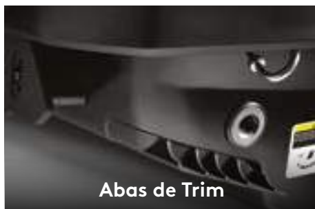
Abas de Trim

Um guidão com ajuste telescópico que otimiza a experiência para os mais variados tamanhos de pilotos.