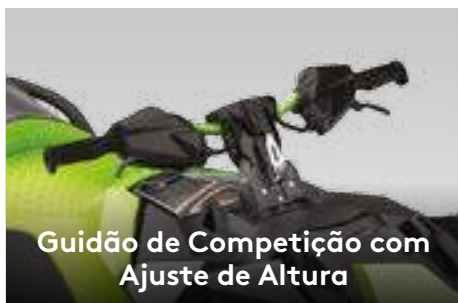
Guidão de Competição com Ajuste de Altura

Um assento com perfil estreito e bolsões profundos para os joelhos permitem ao piloto se encaixar com maior naturalidade e usar as pernas como apoio na pilotagem.